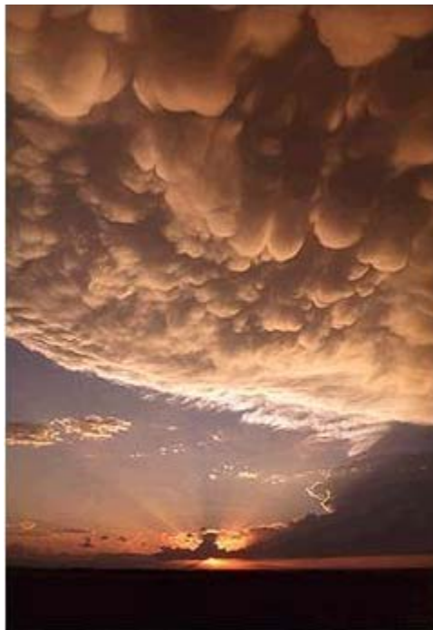
Rayos crepusculares y nubes tipo mammatus en primer plano

Los rayos crepusculares se pueden combinar con atardeceres cálidos, dando lugar a espectáculos hermosísimos en la naturaleza. Como ejemplo tenemos la anterior imagen.