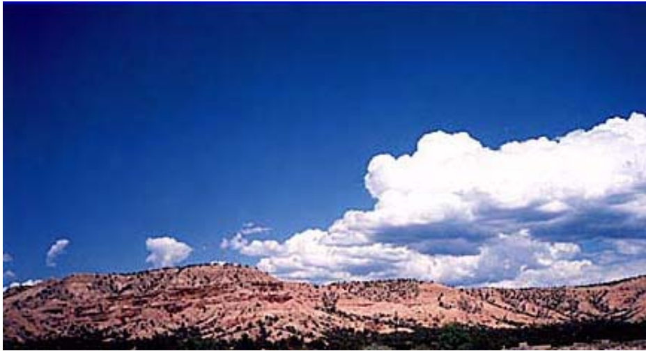
Cielo azul, contrastando con nubes cumuliformes muy blancas. La dispersión de Mie no es selectiva en este caso y la luz blanca solar es devuelta con toda su fuerza por nubes formadas por partículas de gotitas o cristalitas de hielo.

Desgraciadamente en la atmósfera existe gran cantidad de partículas en suspensión que poseen tamaños superiores a las longitudes de onda solares: aerosoles, gotitas de agua, polvo, partículas volcánicas, etc. Gustav Mie, físico alemán, descubrió en 1908, el efecto de dispersión que hoy en día lleva su nombre. Para moléculas o partículas grandes la luz es dispersada, preferentemente, en la misma dirección de incidencia, de forma que, la molécula en suspensión tiende a dispersar la luz en la misma dirección en la que incide. La dispersión de Mie no depende tanto de la longitud de onda incidente como en la de Rayleigh. Cuando observamos las nubes poco espesas, tipo niebla o neblina, vemos que estas son blancas y no azules, esto es, las partículas acuosas no dispersan la luz selectivamente. De la misma forma, las nubes en general dispersan de la misma y por igual la luz solar apareciendo como blancas.