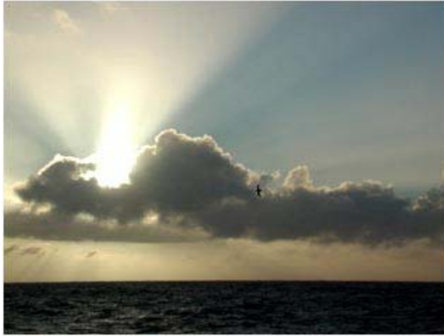
Rayos crepusculares. Los rayos parecen divergir desde un punto de detrás de la nube.

Cuando observamos los carriles o las vías del tren en un terreno llano apreciamos en la lejanía como se confunden en un punto. Las vías paralelas dejan de serlo por un efecto óptico. Este mismo fenómeno se puede observar cuando el sol esta bajo en el horizonte y unas nubes se interponen entre el observador y sol. Todo ocurre como si existiera un foco luminoso puntual justamente detrás de la nube. La lejanía del sol (en el horizonte lejano) hace que los rayos solares los veamos como saliendo y divergiendo de la nube.