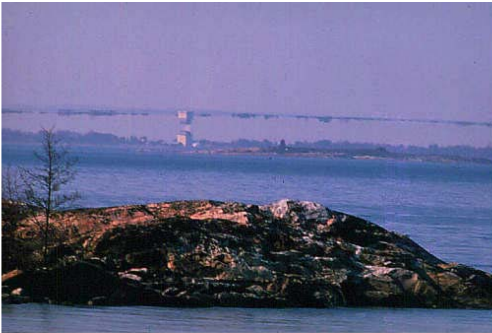
Espejismo superior marítimo. Lo que vemos invertido es una imagen especular de lo que divisamos en el horizonte, pudiendo no divisarse la imagen real que genera el espejismo.