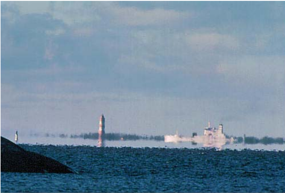
Espejismo inferior marítimo. Las propiedades ópticas de capas bajas favorece la aparición de objetos "directos" más allá del horizonte.

Espejismos inferiores. Este último caso lo tenemos, preferentemente, en los desiertos y en las horas de mucho calor cuando observamos que la carretera se comporta como un espejo. Las fuertes variaciones térmicas en capas bajas generan los espejismos inferiores.