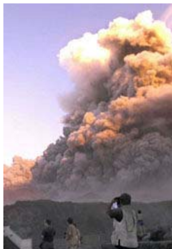
Otro ejemplo pero para una erupción volcánica. Un pirocúmulo se ha formado en este evento con un color blanco diferenciado de la nube volcánica.