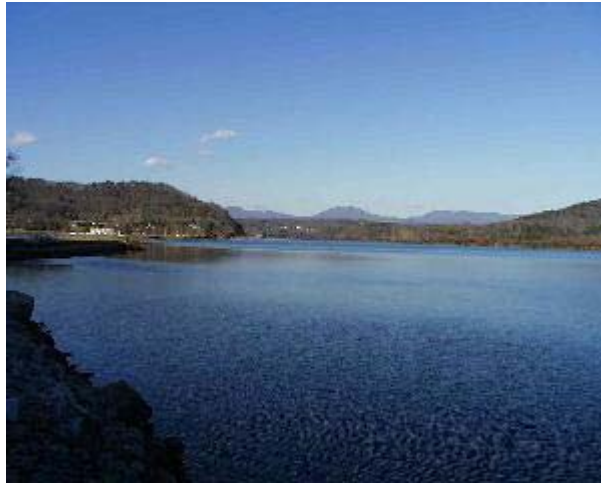
Cielo azul más arriba del horizonte (dispersión de Rayleigh) frente a cielo blanquecino y nubes blancas (dispersión de Mie).