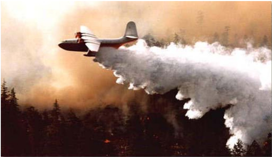
Dispersión de la luz solar en un incendio forestal. La dispersión de Mie es selectiva para las partículas grandes derivadas del incendio. En primer plano aparece la luz reflejada por las gotas de agua que caen del hidroavión, dispersión no selectiva de Mie.

Cuando el tamaño de las partículas en suspensión llega a ser muy apreciable (polvo del desierto, erupciones volcánicas, partículas de incendios forestales, etc. ), entonces éstas de nuevo actúan de forma selectiva y dispersan la luz solar de forma más eficiente en la zona del espectro del infrarrojo. Los atardeceres cercanos a zonas donde se ha inyectado estas sustancias en la atmósfera toman tonalidades amarillo-rojizo-anaranjadas.