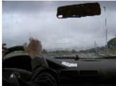
Yendo en el coche