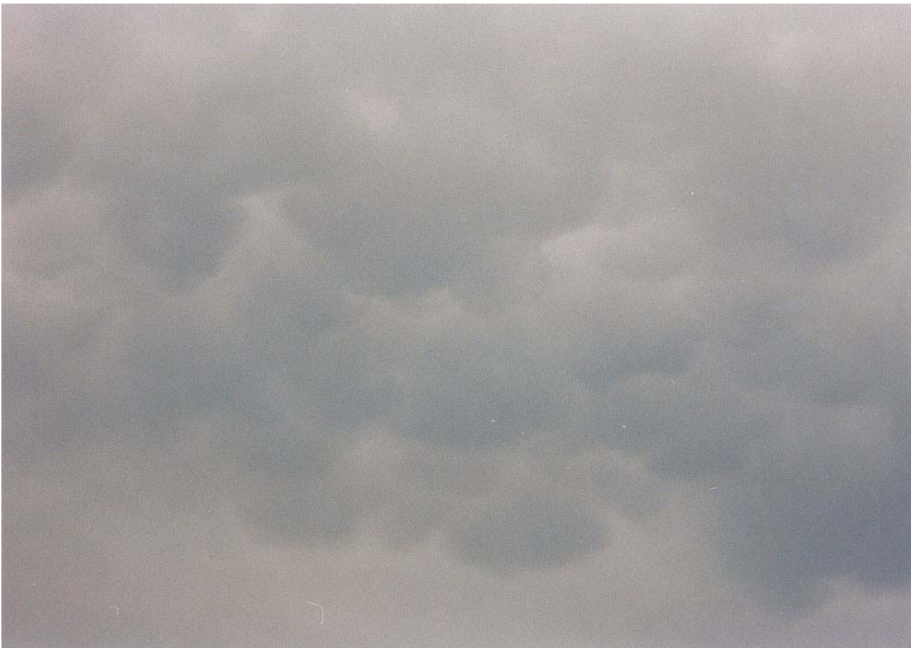
Después de una buena tormenta en la zona de Benasque, el Cb nos ofreció estos bonitos Mammatus el día 29