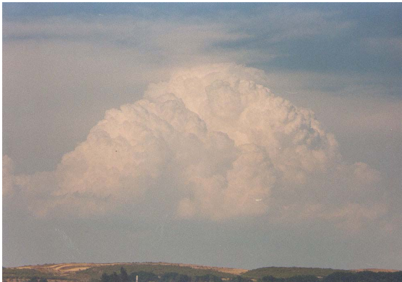
Demolador Cb-Calvus en la zona del Montsèc el dia 29 de julio.